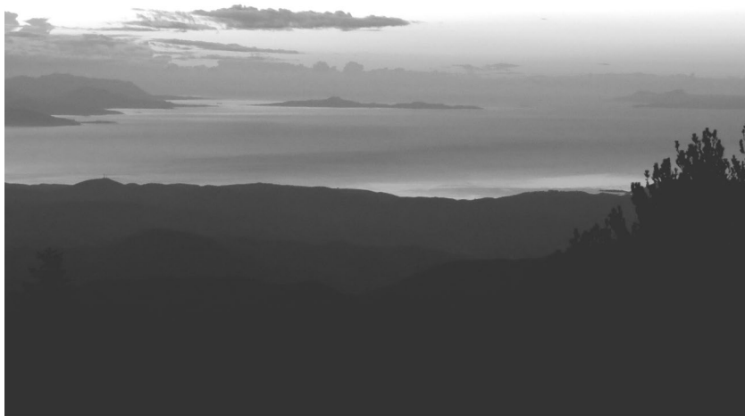
Закат на Лаконском заливе. Вправо — остров Китира, доставлявший много бессонных ночей спартанским царям в их заботах о безопасности родной страны.

Географические особенности Пелопоннеса глубоко повлияли на историю и психологию спартанцев, и потому, изучая становление их выдающегося государства, мы должны уделить пристальное внимание окружающей их местности.