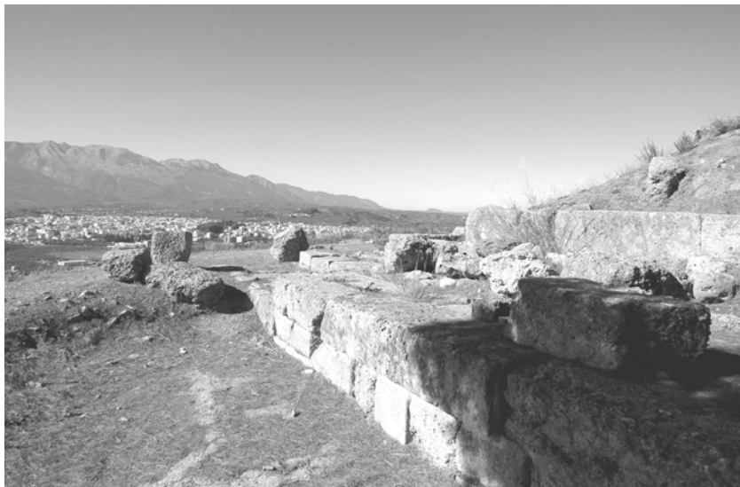
Еще один вид на Менелайон с юга на его западную сторону, обращенную к долине Эвроты.

Племя дорийцев явилось с севера, возможно даже с Балкан. Как и о прочих событиях в Греции «темных веков», наши сведения о вторжении дорийцев смутны и по большей части предположительны. Нельзя исключать и того, что ошибочен даже сам термин, обозначающий их прибытие на Пелопоннес, — «дорийское вторжение», — возможно, этот народ всего лишь желал овладеть пустующими или заброшенными поселениями. Некоторые историки склоняются к мнению, что дорийцы издревле населяли Пелопоннес и, будучи покоренными, во многом находились в таком же положении, какое в дальнейшем Спарта отведет илотам. Во времена катастрофы дорийцы свергли своих угнетателей и забрали власть в свои руки. Каким бы ни было их происхождение, к концу «темных веков» они владели всем Пелопоннесом, в том числе Лаконикой, а спартанцы классической эпохи уже с гордостью именовали себя дорийцами (но только не спартанские цари — по причинам, на которых мы остановимся ниже).